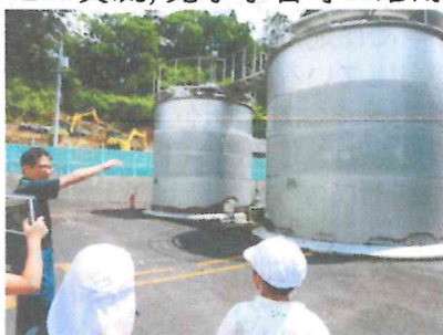
【川原浄水場見学の様子】

・今年度は上場三校(川原小, 塚脇小, 木原小)教育研究会の事務局となっています。他校との交流, 見学学習等に活用していきます。